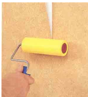
Aandrukken met en roller