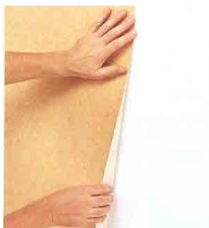
Aanbrengen op de wand