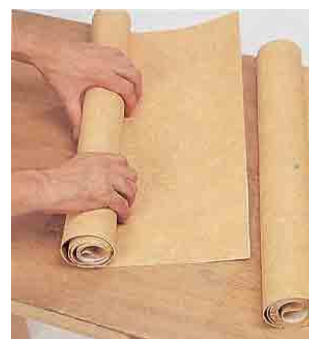
Oprollen en in laten weken